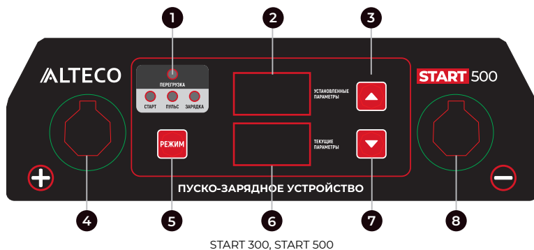
START 300, START 500